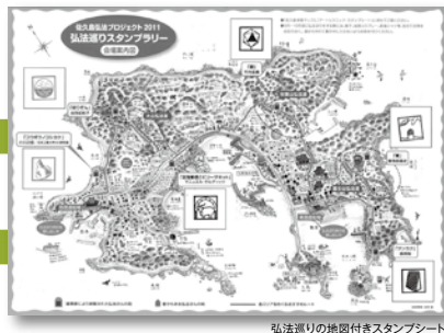
弘法巡りの地図付きスタンプシート

開催期間／4月23日(土)～2012年3月31日(土) 建築家が設計・制作した6つの祠を巡る。2月11日からは18ヶ所に。