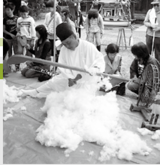
秋に開催される西尾・天竺神社の綿祖祭

4月1日に佐久島のある一色町は、吉良町・幡豆町とともに西尾市と合併しました。その記念事業として、西尾市にある天竺神社から分けてもらった綿の種を育て、綿を収穫し可愛い小物を作るワークショップを4回に分けて開催します。現在の西尾市天竺町に、昔インド人の乗った船が流れ着き、その折日本に初めて綿がもたらされたという伝説があります。10月に収穫した綿でアクセサリーをつくるため、1回目は綿に種のまきをします。一日「畑ガール」になってオーガニックコットン栽培に挑戦しよう!