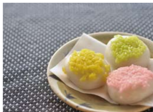
郷土伝統の雛菓子・伊賀まんじゅう