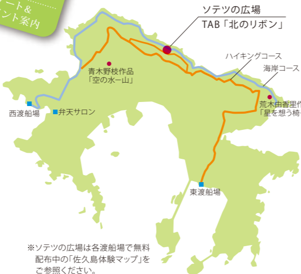
※ソテツの広場は各渡船場で無料配布中の「佐久島体験マップ」をご参照ください。

2本の大きなソテツの木と、古いあずまやがあるばかりの静かな空間に建ち上がった森と海をむすぶ見晴台、それが「北のリボン」です。展覧会終了後も常設される佐久島アートの新たな顔となる作品を、ぜひご覧ください。「北のリボン」は西港渡船場から約2キロ。徒歩25分、自転車で10分の距離です。森の中を行くハイキングコースから訪れるもよし、北側の海岸コースを自転車で走るもよし。ただし冬期の海岸コースは強風のため高波をかぶる恐れがありますので、風の強い日はハイキングコースでお越しください。