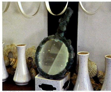
《砂部屋》(インスタレーション)部分 2010年

「佐久島アートピクニック2011」「弘法巡りスタンプラリー」 ぶたつのスタンプラリーを毎日開催中 11月は島内各所で「学生チャレンジ企画 佐久島弘法プロジェクト」の公開制作を行います(渡船場のチラシ参照)