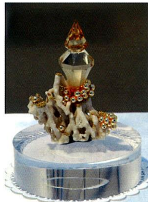
《星空の夜にはお城が見えるでしょう。》2008年