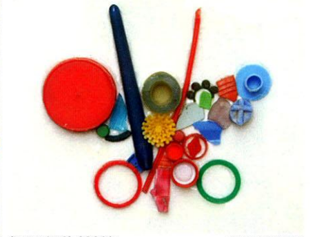
《butterfly 3》2008年